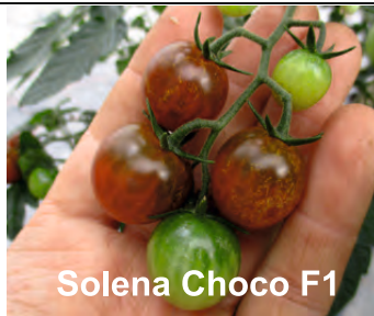
Solena Choco F1